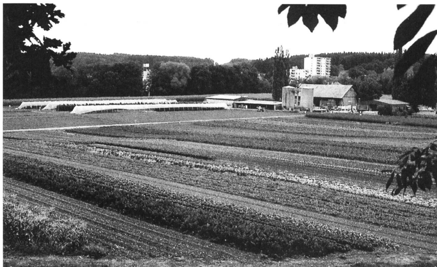
Der Betrieb Ackermann in Niederuzwil