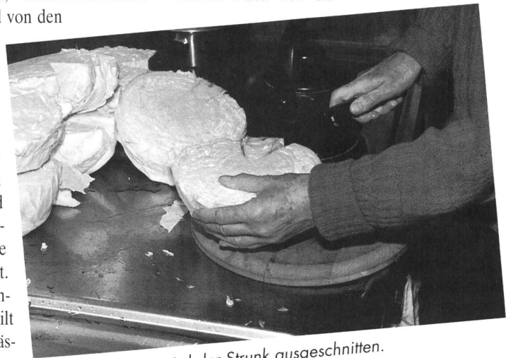
Vor dem Hobeln wird der Strunk ausgeschnitten.

be von Salz der Zellsaft aus. Dieser füllt die Zwischenräume zwischen den Weisskohlschnitzeln, vertreibt die noch verbleibende Luft und bildet den idealen Nährboden für die Milchsäurebakterien. Die günstigen Lebensbedingungen regen die Milchsäurebakterien an, sich zu vermehren und – bei Freisetzung von Kohlensäure – Milchsäure zu bilden. Nach vier- bis