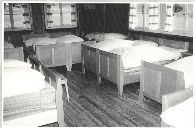
Vom Schlafsaal zu gefälligen Doppelzimmern 1. und 2. Obergeschoss