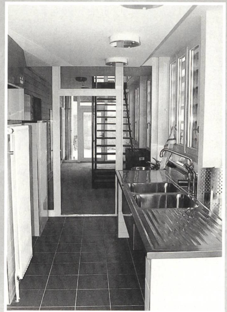
Mit dem Anbau auf der Ostseite wurde Raum für die internen Verkehrswege geschaffen