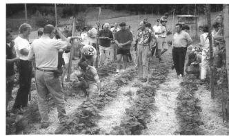
... Information zur Ernte und zur Marktlage; Diskussion über die Vermarktung und die Anforderungen der Abnehmer; gemeinsames Picknick mit Erfahrungsaustausch. Es nahmen über 50 Personen teil, aus Produktion, Forschung, Vermarktung und Verarbeitung.