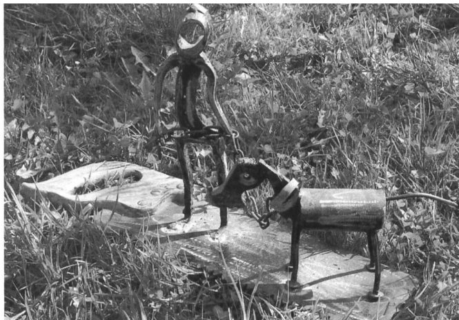
Der Hundedreck im Brunnentrog