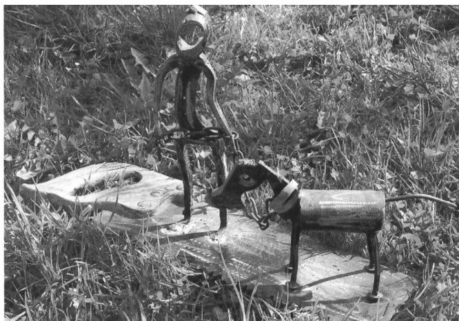
Der Hundedreck im Brunnentrog

Liebe Heidi, das Bild vom Robidogsack, der im Tränkewasser schwimmt, zusammen mit der Vorstellung durstiger Rinder, dreht mir den Magen um und lässt meine Zornader anschwellen. Das heisst, die Sache lässt mich nicht kalt, bringt mich in Wallung. Ich bin fast überzeugt, dass der Urheber dieser Hundsdreckgeschichte genau das beabsichtigt hat. Gedankenlosigkeit kann allenfalls am Rande mitgespielt haben, aber tieferliegende Motive waren wohl mit im Spiel. Hass und Neid auf Menschen, die in der freien Natur mit Tieren zusammenleben können, zum Beispiel. Das bringt mich wieder auf eines meiner Grundanliegen zurück: die Massentierhaltung. Ich bin absolut dafür, dass die breiten Massen sich wieder Tiere halten können, dass Kinder mit lebendigen Wesen und nicht bloss mit Game-Boys heranwachsen. Was gleichzeitig auch heissen würde, die Tiere wieder besser auf die Menschen zu verteilen. Dabei halte ich Ziegen oftmals für bessere Gespanen als «Unter-Hunde.» Sie fordern mehr heraus und lassen sich nicht unterdrücken. Ein Streicheltier mit Hörnern fördert Respekt, Zuneigung und Verantwortungsgefühl. Genau das eben, was unserer zivilisierten Robidogsaubergesellschaft oft abgeht. Vielleicht müsste man die Geschichte vom «Heidi» und dem «Geissenpeter» neu erfinden.