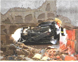
Er hatte die Klappe in der Wand nicht bemerkt.

Gesellschaft, das menschliche Zusammenleben. Und für Beuys war eindeutig nur direkte Demokratie die politische Struktur, die eine solche Verwirklichung ermöglichen kann. Folge seines Wirkens sind unter anderem «Büro und Omnibus für direkte Demokratie in Deutschland» (heute noch aktiv!), wo ziemlich sicher viel vehementer und differenzierter über direkte Demokratie nachgedacht wird als von uns Schweizern. Wichtig scheint mir auch, dass für Beuys das «Kapital» die menschliche Kreativität, Fantasie und Lebenskraft war; er meinte damit nicht der Realwirtschaft entzogene und hochkantig gestapelte Geldwerte. Als Pädagoge sprach er also indirekt von den Kindern (in den Menschen), wenn er «Kapital» sagte.