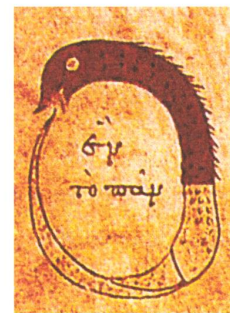
Ouroboros: Ein symbolisches Bild ca. aus dem 10. Jahrhundert zum Kreislauf des Vielen im Einen (griechische Inschrift «en to pan»).

Als der berühmte Biologe Louis Pasteur (1822–1895) die Bakterien erforschte und das Pasteurisieren erfand, hatte er einen «feindlichen Bruder»: Antoine Béchamp (1816–1908). Die beiden bekämpften sich lebenslanglich, besonders nachdem Béchamp Pasteur vorwarf, er habe ihm seine mikrobiologische Erklärung der Seidenraupenkrankheit geklaut und manches mehr. Der tiefere Zwist war aber ein anderer: Béchamp sah nicht, wie Pasteur, Zellen und Einzeller als kleinste Einheiten des Lebens an, sondern sogenannte «Mikrozyme» 3 : kleine Körnchen des Lebens, die im Kreislauf aus zerfallenden Zellen entstünden und dann, durch einige Wandlungsprozesse hindurch, wieder neue Gewebe und lebende Zellen aus sich zusammensetzten. Béchamps vorstellungsleitender Glaubenssatz war dabei: «Nichts fällt dem Tode anheim, alles dem Leben.» 4