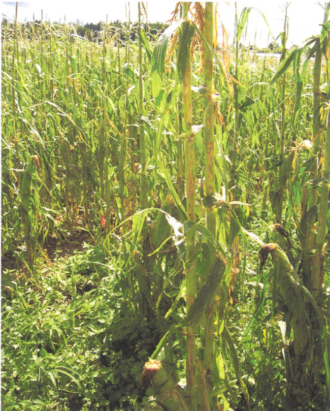
Der Zuckermais, Abts Hauptkultur im Feldgemüsebau, ist kurz vor der Ernte von einem starken Hagelwetter heimgesucht worden.

bäuerliche und nichtbäuerliche Besucher/innen haben sich anlässlich von Führungen schon davon überzeugen können. « Bäuerliches » Denken und Handeln ist nicht an die Betriebsgrösse ge-