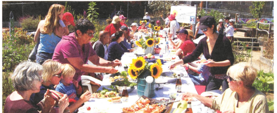
Slow Food Eat-In: gemeinschaftliches Essen ohne Multitasking als politischer Akt in Zeiten der Anonymität und Hyperaktivität?

Lemke nimmt kein Blatt vor den Mund, wenn er vom «Massaker des Hungers», vom «Dritten Weltkrieg» (Jean Ziegler) oder von der «Politik des kontrollierten Massensterbens des verwalteten Welthungers» schreibt. Die Banken habe man mit Unsummen gerettet, nicht aber die hungernden Menschen, empört sich der Autor. Lemke ist es wichtig, den Hun-