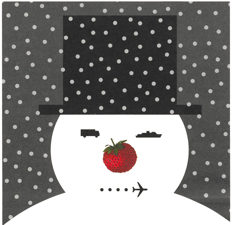
Eine Verwertungsmöglichkeit für geschmacksneutrale Erdbeeren im Winter – Poster der Ausstellung «Erdbeeren im Winter – Ein Klimamärchen». Siehe dazu auch den Film «Planet der Ziemlichschlauen»: http://www.planeterziemlichschlauen.ch Illustration: Claude Kuhn

Zu Hause war ich gespannt, denn es liess sich ein entfernter Erdbeergeruch ausmachen. Ich biss in eine der makellosen Früchte, die gut geordnet alle einzeln auf ihrem Stängel sass. Tatsächlich verspürte ich «Biss», die Beere, wenn es denn eine Beere war, war dicht und zäh. Ich wartete auf den Geschmack, aber durch den schwachen Anflug von erdbeerig kam dominant die Note des Presskartons durch, auf dem die Erdbeeren ohne jeden Tropfen Saft lagerten. Das trotzdem etwas feuchte