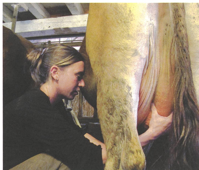
...Die Mensch-Tier-Beziehung (im Bild: Rena und Ivana) kann der Roboter aber nicht ersetzen. Diese ist wichtig für das soziale Klima in der Herde und die Stressvermeidung beim Kontakt mit Menschen.