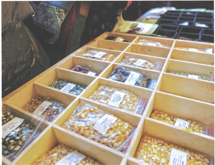
Landwirtschaft als Kulturleistung: GärtnerInnen und BäuerInnen züchten mit alten, standortangepassten Sorten und geben das Saatgut günstig weiter – hier am Saatgut-Festival Iphofen 2014. So wird die Sortenvielfalt und die Unabhängigkeit von grossen Saatgut-Unternehmen bewahrt.

Bestandteil der Entstehung der Ökolandwirtschaft war eine intensive Erforschung dazu, was die Qualität der Milch ausmacht, z. B. gutes Futter für die Tiere, Frische der Milch, achtsame Verarbeitung. Weiterverarbeitung und Weitervermarktung von Milch wurde für viele Betriebe ein wichtiges Standbein, wenn hier auch viel Lehrgeld bezahlt werden musste. Es entstand zum Austausch von Erfahrungen der «Verein für handwerkliche Milchverarbeitung». Heute aber sieht der Alltag so aus: Bio-H-Milch (UHT); homogenisierte Biomilch mit reduziertem Fettgehalt; Biomilch, die schon viele Tage alt ist, die schon viele Wege hinter sich hat, die als – bezüglich Erzeugerbetrieb – anonyme Handelsmarke daherkommt. Als eine neue «Spitze des Eisbergs» sind die Pläne einer Biomolkerei im Süden Deutschlands zu nennen, die grösseren Biomilchbetrieben einen höheren Milchpreis dadurch ermöglichen möchte, dass man den Milchpreis, den die Betriebe mit einer kleineren Milchviehherde erhalten, absenkt. Natürlich hat auch der staatliche Umgang mit dem Gesichtspunkt Hygiene eine wichtige Rolle beim Verlust von Qualität gespielt, beispielsweise das Verbot der Abgabe von nicht-pasteurisierter Milch an Einrichtungen der Gemeinschaftsverpflegung; oder die massive Behinderung bei der Erzeugung von