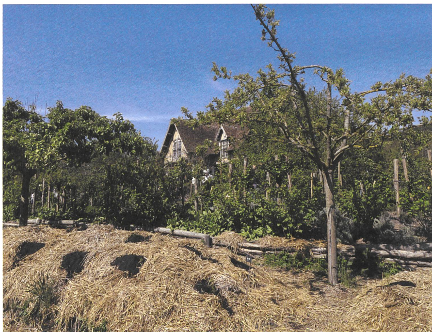
Paradiesisch und ertragreich – auf der Ferme du Bec Hellouin in der Normandie wird sehr intensiv Obst und Gemüse nach Permakulturart angebaut.

Die durch Direktzahlungen geförderte konventionelle wie auch biologische Landwirtschaft unterscheidet zwischen Produktionsflächen und Biodiversitätsförderflächen. «In einem Permakultur-System hingegen vermischen sich Lebensmittelproduktion und