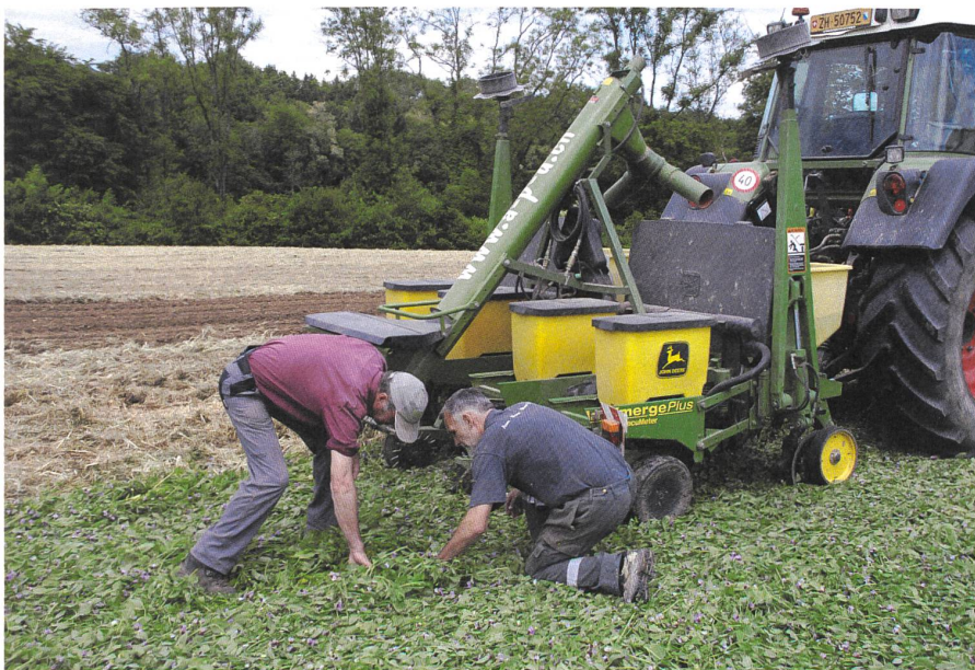
Kontrolle einer Direktsaat

Im Vergleich zum Projektstart stehen heute viel mehr und bessere Maschinen zur Verfügung. Kenntnisse über die Regulierung der Unkräuter haben sich entscheidend verbessert. Dank dem Austausch und der Praxisversuche konnten viele neue Erkenntnisse zugunsten von Neueinsteigern gewonnen werden. Die Direktsaat ist heute unter guten Bedingungen praxisreif. Die Direktzahlungen für schonende Bodenbearbeitung und spezielle Beiträge für den herbizidlosen Anbau haben der schonenden Bodenbearbeitung zusätzlichen Schwung gegeben. In den letzten 5 Jahren wurden dank diesem Coop-Projekt grosse Fortschritte gemacht und ein Netz mit 18 Vorzeigetrieben aufgebaut. Die Umstellung auf die reduzierte Bodenbearbeitung braucht eine längere Zeit und die notwendige Erfahrung. Noch sind viele Fragen offen und lange nicht alle Probleme gelöst. Deshalb unterstützen die Bio Suisse und die Stiftung sur la Croix die Weiterführung des Umsetzungsteils. Das Projekt wird auf weniger Betrieben weitergeführt. Das System wird flexibler. Die beteiligten Betriebe können alle Kulturen mit reduzierter Bodenbearbeitung anbauen. Was wir brauchen ist in jedem Fall einen Streifen mit der Standardmethode Pflug und wenn möglich noch ein Verfahren mit Direktsaat. Betriebe, die an einem begleiteten Praxisversuch mitmachen wollen, können sich gerne bei uns melden. ●