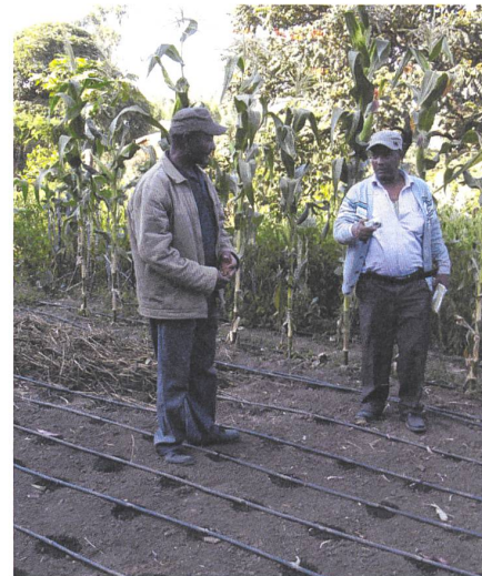
Biobauern mit Tröpfchenbewässerung für Gemüse in Äthiopien

Flury: Im Jahr 2010 starteten 54 Länder der Afrikanischen Union (AU) die «Ecological Organic Agriculture Initiative»: das ist eine Koalition von zivilgesellschaftlichen, privaten und staatlichen Organisationen unter Oberaufsicht der AU. Die DEZA unterstützt diese Initiative darin, afrikanisches Biolandbau-Wissen zu dokumentieren, Bäuerinnen und Bauern zur Umstellung zu motivieren