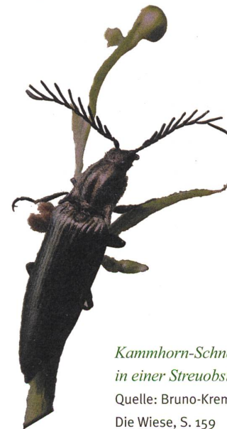
Kammhorn-Schnellkäfer in einer Streuobstwiese.

Geschäftsstelle Bioforum Schweiz Lukas van Puijenbroek Aebletenweg 32 8706 Meilen 044 520 90 19 www.bioforumschweiz.ch