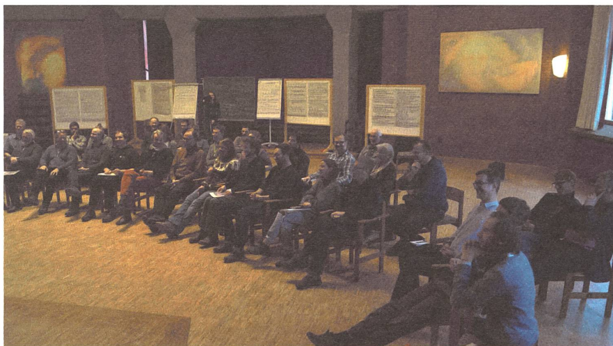
Gastgeber des Jahrestreffens war die Dorfgemeinschaft Lehenhof, wo ca. 300 Menschen in landwirtschaftlichem und gärtnerischem, handwerklichem und therapeutischem Kontext tätig sind.

Manche Partnerhöfe sind zum Bodenfruchtbarkeitsfonds gekommen, weil sie mit bereits langjährigen Fragen und Problemen endlich weiterkommen möchten. Zum Beispiel der inneren Erosion: Ein Ackerbauer, der auf Feldgemüse spezialisiert ist, sagte: «Unsere Böden haben einen sehr hohen Schluffanteil. Der löst sich bei allem, was Wasser heisst, sickert auch tiefer und lagert sich weiter unten im Boden ziemlich dicht zusammen. Was können wir da tun?» Was alles gemacht wird, dreht sich meist um: