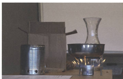
Der Recyclingkocher steht symbolisch für die drei Pfeiler Energieeffizienz, Suffizienz und Konsistenz.