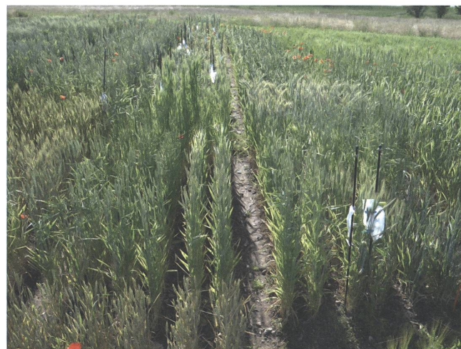
Auch im Zuchtgarten der gzpk in Feldbach ist ein üppiges, farben- und formenfrohes Klimafenster gewachsen. Hier Aufnahmen aus den Monaten April, Mai, Juni und Juli.