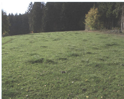
Geilstellen prägen Weiden.