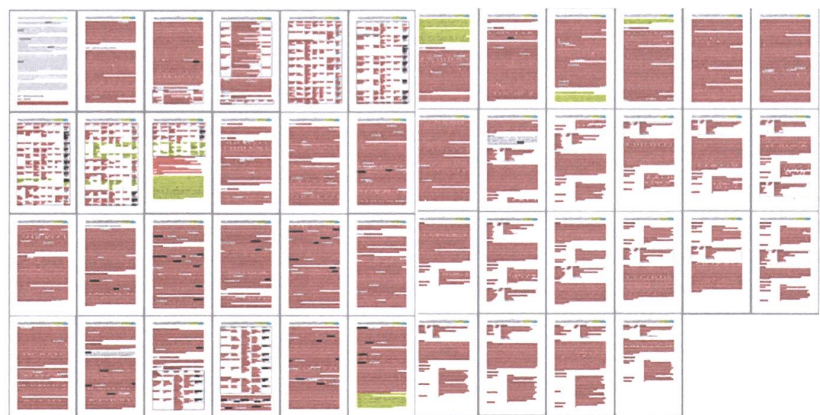
Diese Grafik zeigt durch rote Textmarkierung, wie das deutsche Bundesamt für Risikobewertung bei ihrer Bewertung mit Monsanto-Originaltext arbeitete. Gelb sind Stellen aus anderen Studien.