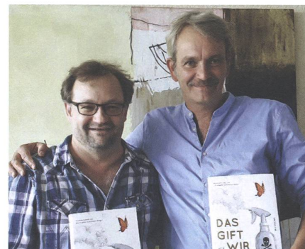
Mathias Forster und Chr. Schümann

Ursprünglich sollte diese Publikation eine Sonderausgabe des Magazins unseres in Arlesheim BL ansässigen Bodenfruchtbarkeits-