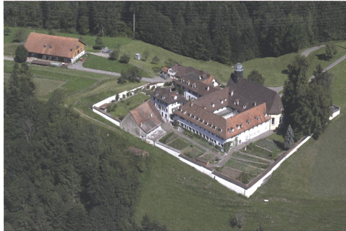
Der Bauernhof des Frauenklosters Wonenstein in Niderteufern AR war 25 Jahre lang Lebens- und Arbeitsort.

Am Klosterbetrieb, wo ich gearbeitet habe, wird dieser Wandel sichtbar. Der grosszügige Stall wurde 1896 gebaut.