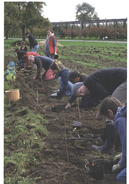
Landwirtschaft von unten.»

Landwirtschaft und Landschaft sind untrennbar verknüpft. Im Zusammenspiel mit den lokalen natürlichen Gegebenheiten bilden sie die «basale» Ebene für menschliche Existenz. Dieser Bedingtheit können sich auch demokratisch verfasste Gesellschaften nicht entziehen. Seit bald 350 Jahren bauen sie jedoch auf der Zerstörung ihrer natürlichen Grundlage auf. Vom Verschwinden der Bisons in Nordamerika führt eine lange, aber direkte Linie zur Verschmutzung des Trinkwassers in der Schweiz. Wie können wir mit dieser