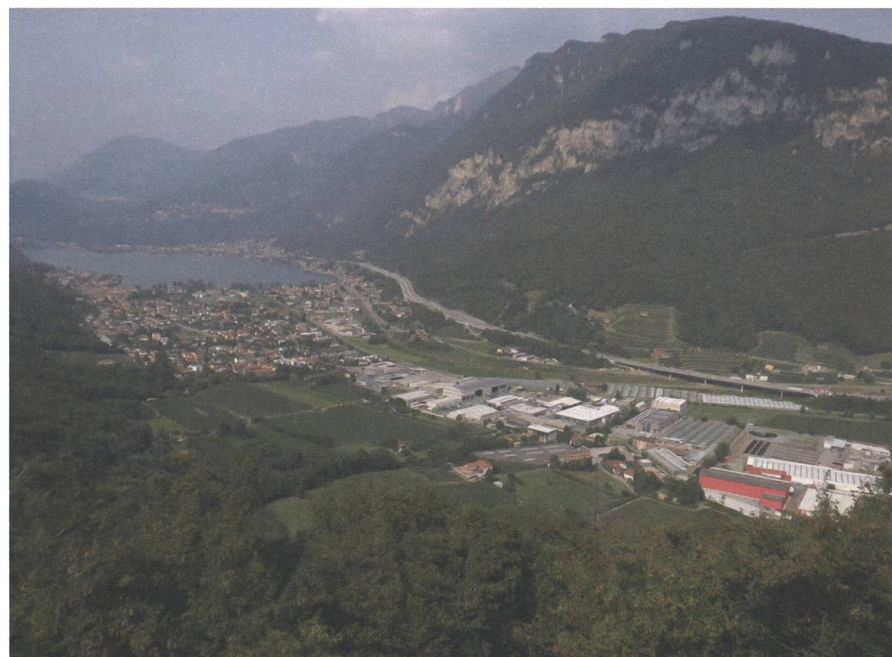
Konfliktvolle Berechtigungsansprüche auf das Land (am Luganersee).

So betrachtet kann man auch die vergangene Abstimmung über die Agrarinitiativen als Kampf um Zulassung und Ausgrenzung deuten. Die chemische Industrie wollte von einem wichtigen Einflussbereich nicht ausgeschlossen werden, genauso wenig wie die Fenaco und die ihr angehörigen industriellen und dienstleistenden Betriebe. Bio Suisse schützte ihren Preisvorteil und eigene problematische Praktiken, statt den selbst definierten Berechtigungsraum zu öffnen und nachhaltiger zu machen. Gegen dieses seltsame Krätegemisch wollten sich 40% der Bevölkerung die Berechtigung für eine pestizidfreie Landwirtschaft erkämpfen. Solidarität mit der Umwelt unterlag gegen Solidarität mit dem bestehenden geldorientierten Geschäftsmodell.