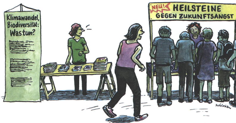
Die prioritären Sorgen der Leute.

Das Interesse von Wirtschaftsverbänden am gut geschmierten Ist-Zustand, wozu auch der Bauernverband am Gängelband der Fenaco gehört, darf man unter Opportunismus verbuchen. So, wie sich die Erdöllobby nicht gegen zunehmenden Verkehr sträubt, so macht sich auch der Landmaschinenverband nicht stark für eine geringere Mechanisierung der Landwirtschaft. Und die chemische Industrie unterstützt bestimmt keine Pestizid- oder