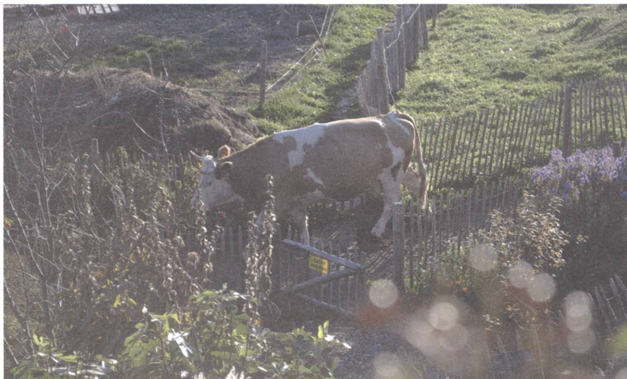
Regelmässiger Weidegang verbessert die Tiergesundheit: Kuh vom Biohof Schüpfenried.

Das Thema Massentierhaltung hat ein hohes Mobilisierungspotenzial , denn das Tierwohl ist erfreulicherweise vielen Menschen ein grosses Anliegen. Trotzdem müssen wir uns nichts vormachen: Die Agrarlobby hat den Einfluss und die Mittel, sowohl die Alternativen zur Initiative im Parlament zu versenken als auch die Volksabstimmung zu gewinnen. Die gängigen Angstmacher-Argumente wie höhere Preise oder nicht umsetzbare Anforderungen werden auch hier eingesetzt werden und ihre Wirkung nicht verfehlen. Die Frage ist einfach, wer wirklich davon profitiert. Denn die Kleinbauern-Vereinigung ist überzeugt, dass bei einer Ablehnung der Initiative oder eines allfälligen Gegenentwurfs die Bäuerinnen und Bauern nur verlieren können.