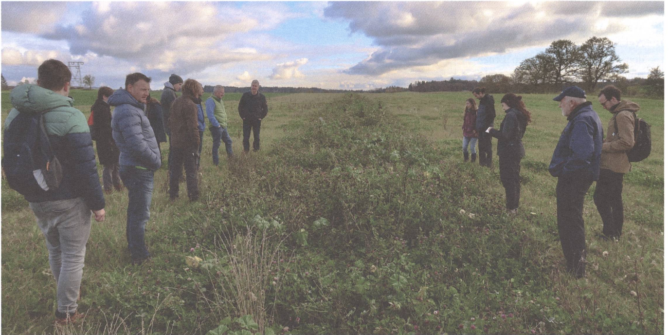
Diskussion um Blühstreifen auf dem Hof Farngut.