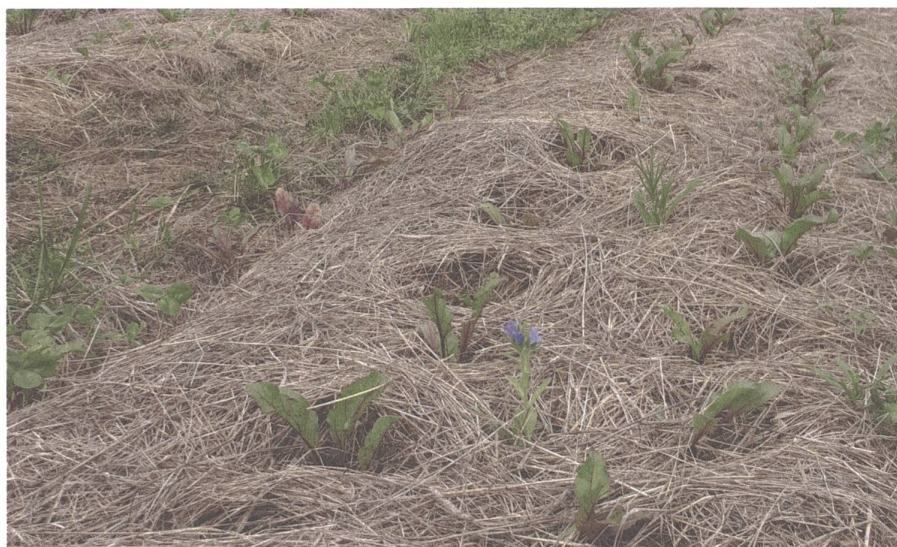
Randensetzlinge in eine dicke Mulchschicht gepflanzt, mit begrüntem Wegen und Blumen für Nützlinge.

Je nach Quelle können die Prinzipien der regenerativen Landwirtschaft auf folgende vier bis fünf Punkte zusammengefasst werden: