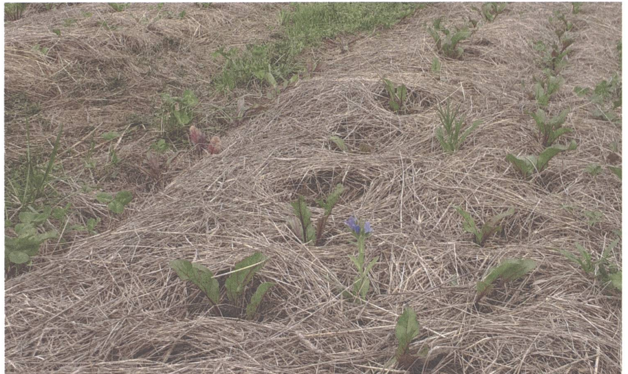
Randensetzlinge in eine dicke Mulchschicht gepflanzt, mit begrüntem Wegen und Blumen für Nützlinge.

Je nach Quelle können die Prinzipien der regenerativen Landwirtschaft auf folgende vier bis fünf Punkte zusammengefasst werden: