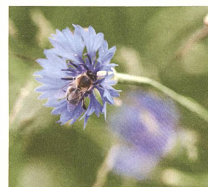
Intakte Natur durch biologische Vielfalt