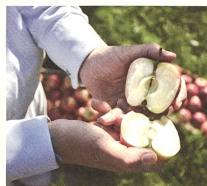
Hochwertige, geprüfte Rohstoffe