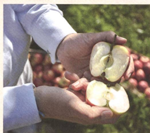
Hochwertige, geprüfte Rohstoffe