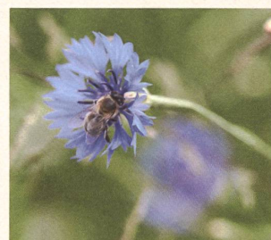
Intakte Natur durch biologische Vielfalt