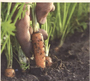
Bio-Anbau seit über 60 Jahren