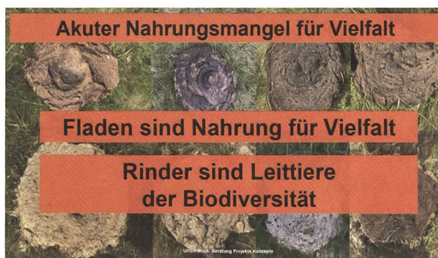
Auch die plakativen Folien sprechen die Zuhörer an.

ner- und Schweinefleischverbrauch.» Denn von Grünland lebende Rinder sind keine Nahrungskonkurrenten des Menschen. Entgegen landläufigen Annahmen haben Rinder «die höchste Lebensmittel-Konversions-Effizienz» aller Nutztiere: Bei nur 10 % lebensmitteltauglichem Futteranteil verwandeln sie, was sie fressen, gemäss einer wissenschaftlichen Studie für den Alpenraum «3,5-mal (Energie) bzw. 4,2-mal (Eiweiss) besser als Masthühner oder Schweine in das Lebensmittel Fleisch».