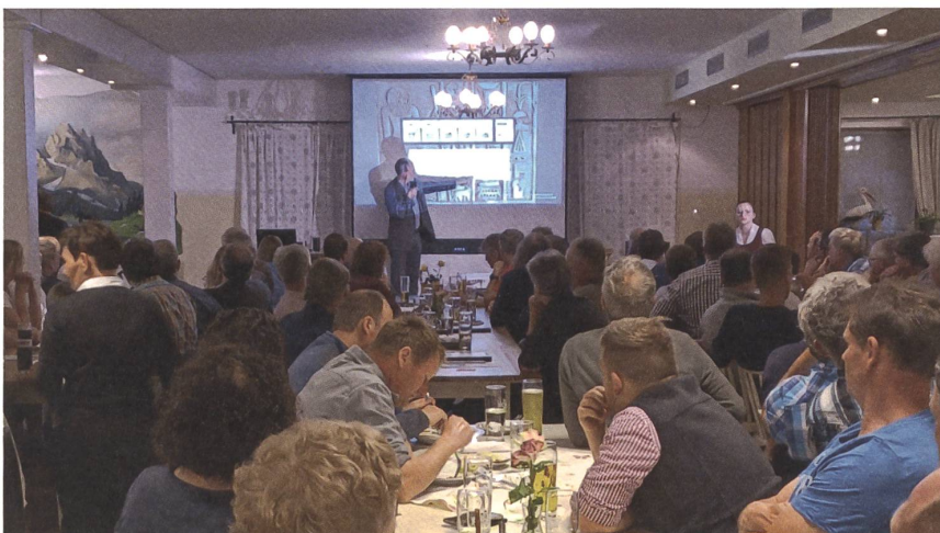
So sieht das dann in Bayern aus.

Die «lebensbezogenen Zusammenhänge» der regionalen Rinderhaltung mit Milch, Kalb, Kuh und Masttieren sowie die Bedeutung des Ökogrünlands und der Rinder für die Böden, die Lebensvielfalt und das Klima müssten den Essenden wieder klargemacht werden. «Die Erhaltung von biodiverserem Grünland braucht Menschen, die Rindfleisch essen!» Aber in Deutschland zum Beispiel habe sich der Rindfleischkonsum seit 1960 zugunsten von Geflügel- und Schweinefleisch fast halbiert und macht jetzt nur noch 15% aller Fleischgerichte aus – es kommen viel zu hohe rund 83% von Schwein und Geflügel. Dabei sei die Rinderhaltung für den gesamten Ökolandbau systemisch unverzichtbar, denn 57% der ökologisch bewirtschafteten Flächen in D sind Grünland, dazu kommt das Klee-gras