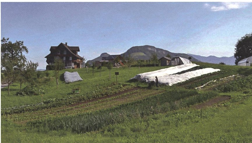
Durch agrarökologische Intensivierung kann die Landwirtschaft wieder Vollerwerb werden.

Die Anbauplanung wird mit dem Programm Gemüse-Anbauplaner der Firma Rukola Soft erstellt. Anita findet das