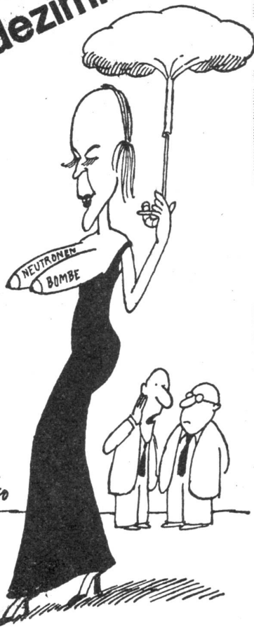
«Valerie spielt im europäischen Film plötzlich wieder eine Bombenrolle.» TA 27.6.80

Potenznot und Potenzsucht dezimieren das asiatische Panzernashorn