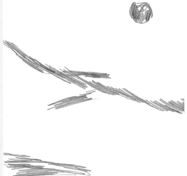
Mein Herz am 7.2.98 um 18 25