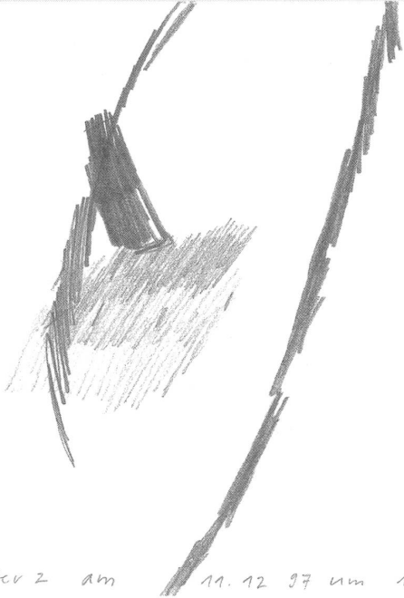
Mein Herz am 11.12.97 um 18 20