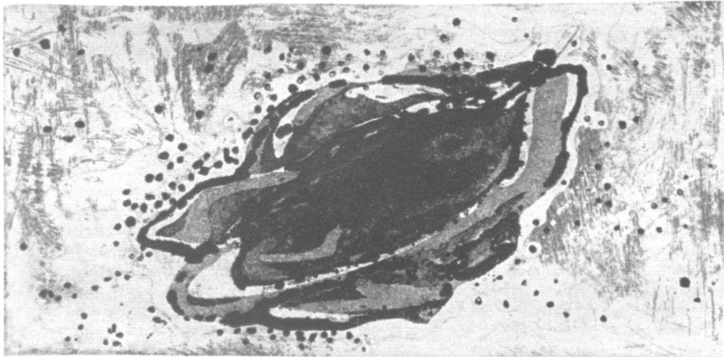
7/10 Mundo interior II A. Peterhans '95