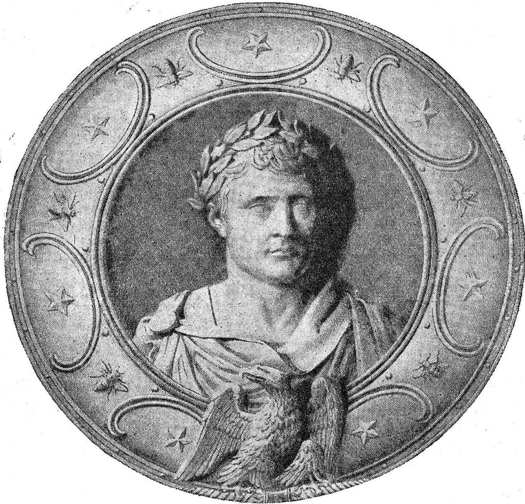
Abb. 14. Medaillon aus dem Titelblatt von Visconti, Iconographie grecque . Paris. Didot. 1808.