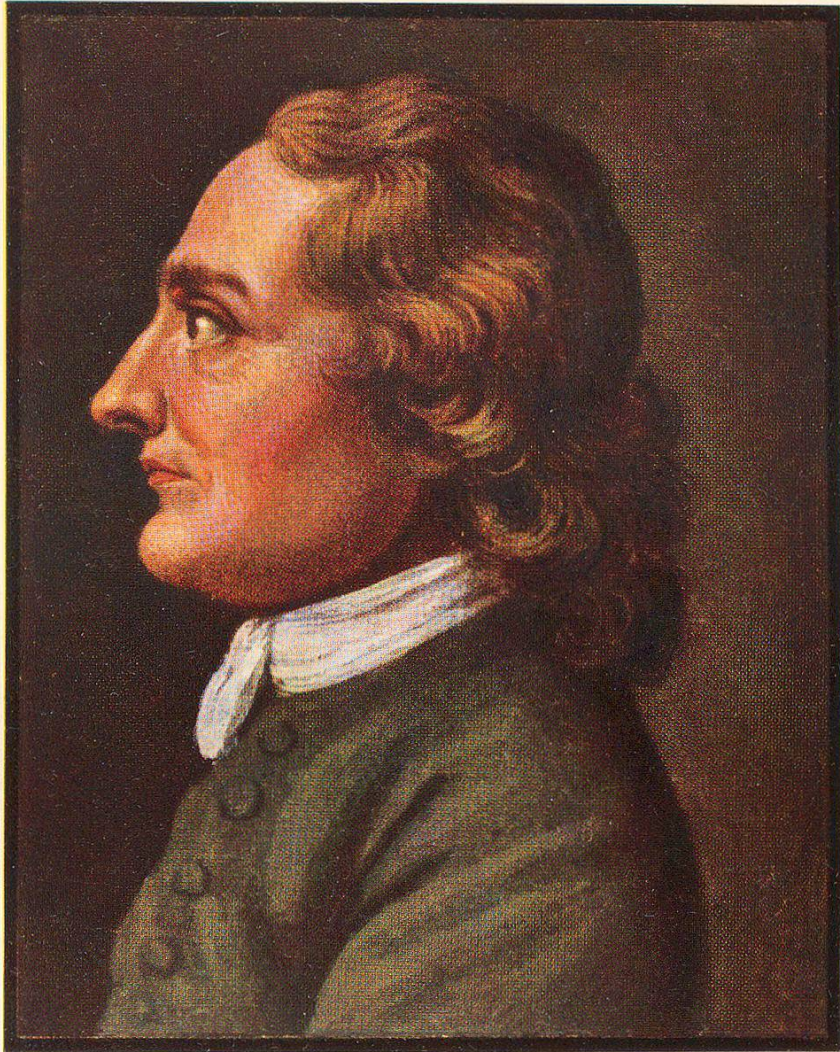
Goethe-Bildnis Miniaturmalerei im Besitze von H. Blass-Laufer, Zürich