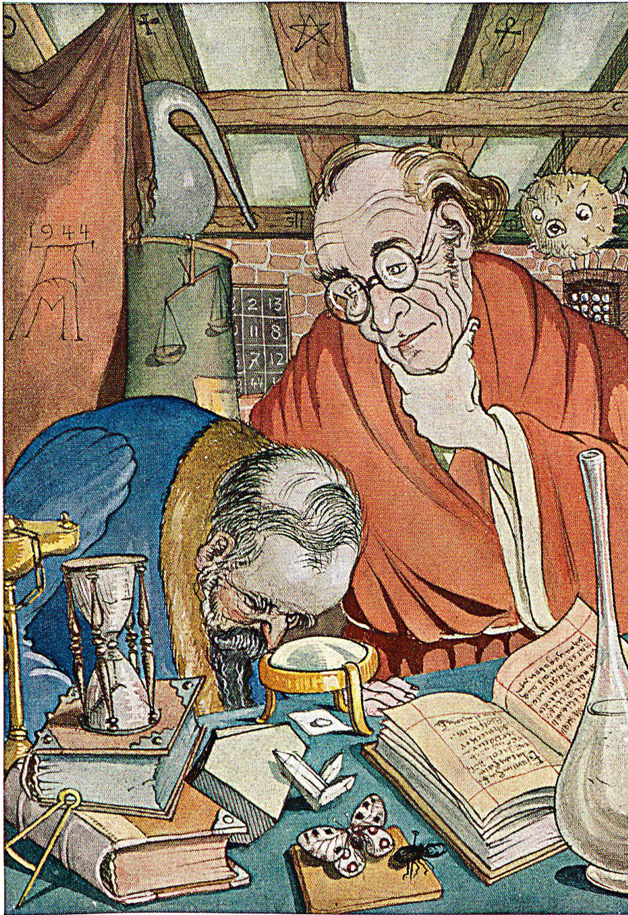
Albert Merckling-Montagnola | Bild zu Andersens Märchen Schweizer Druck- und Verlagshaus, Zürich, 1944