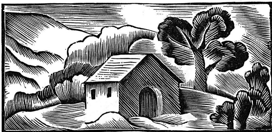
Henry Bischoff / Bois original. Vignette parue dans Ed. Gilliard: «Le pouvoir des Vaudois». Edition du Verseau

compte des marges et qui étalent jusqu'aux bords du papier leurs arabesques échevelées.