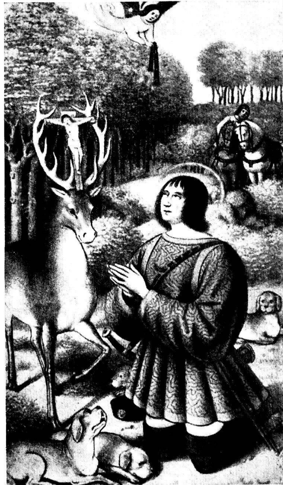
Jean Bourdichon (1457–1521): Der hl. Hubertus, vor dem Hirsche kniend. Miniatur in den sog. «Grandes Heures de la Reine Anne de Bretagne» (1476–1514). Paris, Bibliothèque Nationale, Msc. latin No. 9474

schlägiger Literatur bei der Stiftsbibliothek und der Stadtbibliothek «Vadiana» St. Gallen, in den Kupferstichkabinetten der Museen Basel, Zürich, Bern usw. aufmerksam wurde auf das vielseitige, herrliche Bildmaterial, die erwähnten Legenden betreffend. Bedeutendste Maler und Bildhauer widmeten sich ihrer seit dem 13. Jahrhundert und gestalteten sie mit Hingebung. Es ist mir gelungen, über 30 solcher Darstellungen des Hirschmotivs aufzustöbern und sie in Freundeskreisen, ergänzend zu einem Referat, als Lichtbilderfolge zu verwenden, die