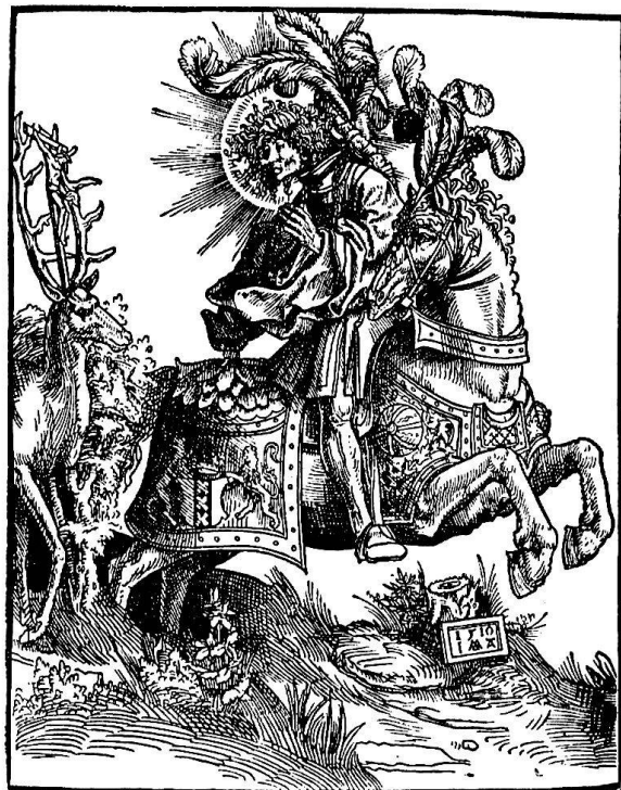
Jacob Cornelisz van Oostanen (1470–1533): Vision des hl. Hubertus zu Pferde. Holzchnitt von 1510

Wie lohnend ist es, sich in den Geist der Legenden zu versetzen! Die wunderbaren Beschreibungen und Geschichten edler Gestalten brachten in jenen dunkeln Jahrhunderten Erbauung und galten als Vorbilder zur Erweckung ähnlicher Tugend und Andacht. Eine wahre Fundgrube eröffnete sich mir, als ich auf der Suche nach ein-