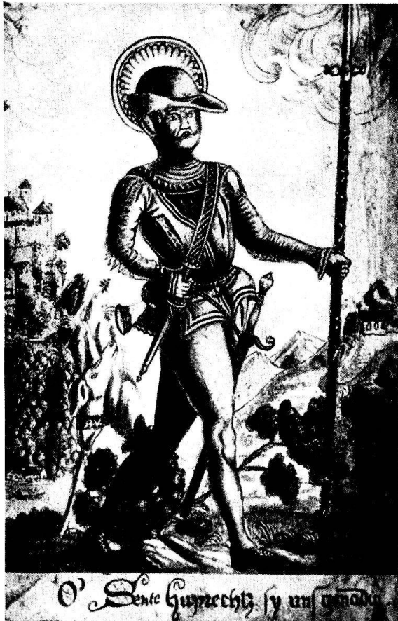
Anonym. Deutschland, Anfang 16. Jahrhundert: Der hl. Hubertus. «O' Sente Huprechtz sy uns genadig.» Miniatur auf der Deckelseite des Einschreibbuchs der Bruderschaft vom hl. Hubertus. München, Bayerische Staatsbibliothek

schlägiger Literatur bei der Stiftsbibliothek und der Stadtbibliothek «Vadiana» St. Gallen, in den Kupferstichkabinetten der Museen Basel, Zürich, Bern usw. aufmerksam wurde auf das vielseitige, herrliche Bildmaterial, die erwähnten Legenden betreffend. Bedeutendste Maler und Bildhauer widmeten sich ihrer seit dem 13. Jahrhundert und gestalteten sie mit Hingebung. Es ist mir gelungen, über 30 solcher Darstellungen des Hirschmotivs aufzustöbern und sie in Freundeskreisen, ergänzend zu einem Referat, als Lichtbilderfolge zu verwenden, die