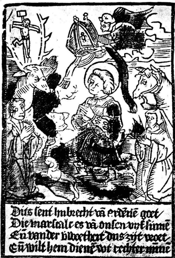
Anonym. Rheinlande, gegen 1500: Der hl. Hubertus, zwischen Andächtigen vor dem Hirsche kniend. Kolorierter Einblattholzchnitt mit der Legende: «Dits sent hubrecht va ardene goet ...», eingeklebt auf den hinteren Deckel eines Kölner-Druckes von 1515. Köln, Priester-Seminar

vor seiner Bekehrung Placidus genannt, war ein römischer General, der durch die Begegnung mit dem kreuztragenden Hirsch zum christlichen Glauben übertrat und in der Folge den Märtyrertod erlitt.