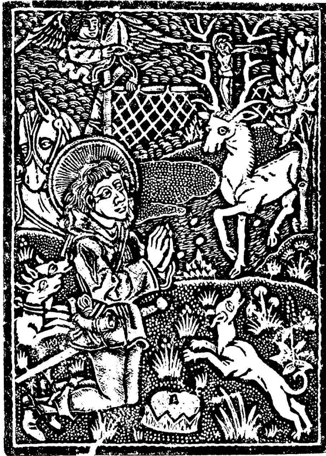
Anonym. Mitteldeutsch, um 1470: Der hl. Hubertus. Nürnberg, Germanisches Nationalmuseum