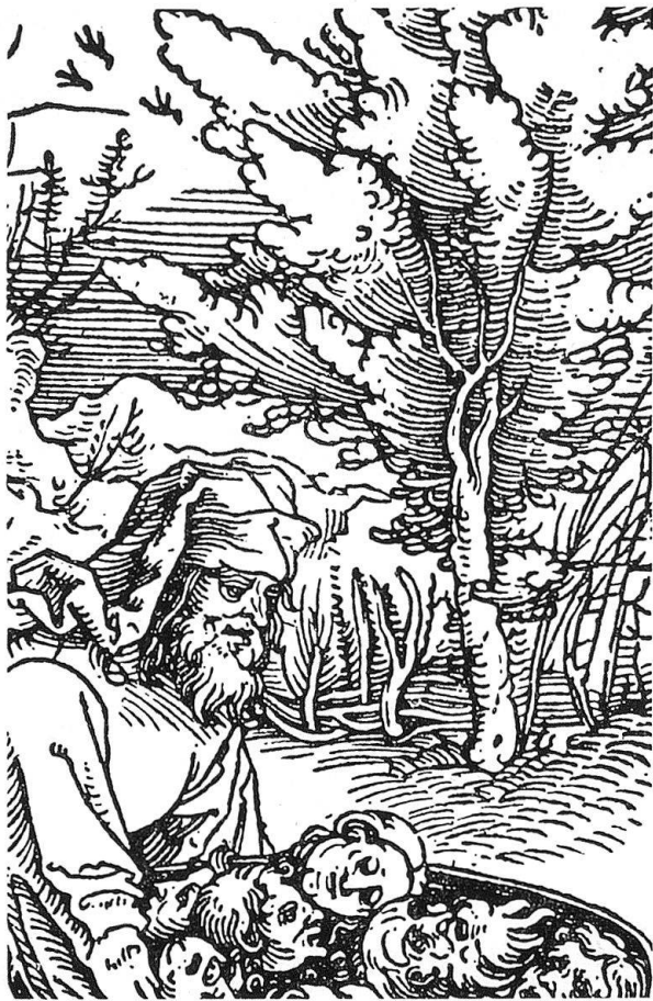
Abb. 11. Petrarcameister, Detail des Holzschnitts M. 489 aus Cicero, 1531

men mit den Stämmchen im Trostspiegelholzschnitt «Einer Glück und Unglück wägend» (M. 60), oder den Stämmchen in der Wildemannsdarstellung (M. 542). Im letztgenannten Schnitt wird einer der Bäume mit einer über der Erde laufenden Wurzel dargestellt, wie sie ähnlich am Baumstamm neben der Bartholomäusgestalt zu finden ist.