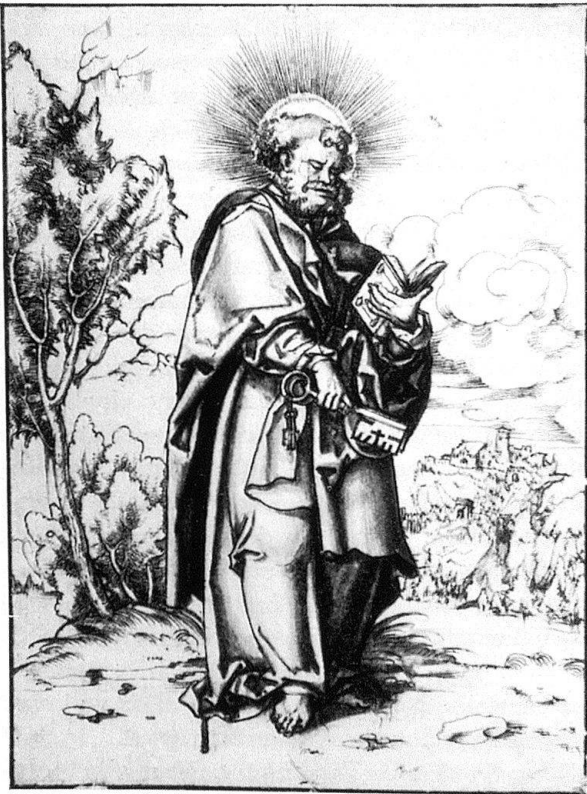
Abb. 8. Apostel Petrus