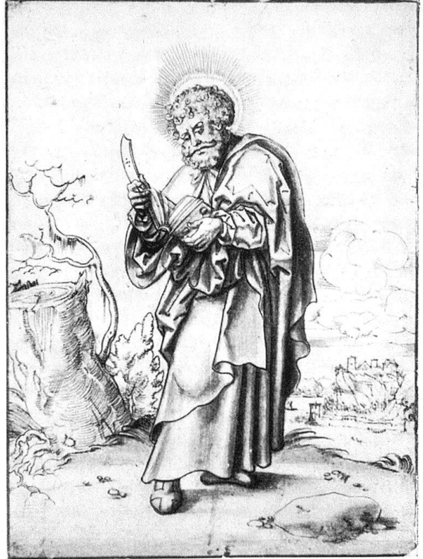
Abb. 7. Apostel Bartholomäus