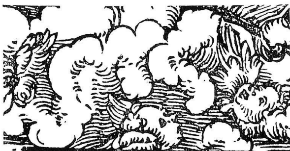
Abb. 1. Petrarcomeister, Detail des Holzschnitts M. 371