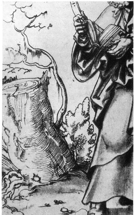
Abb. 14. Detail aus Abb. 7

Aus all diesen Übereinstimmungen ergibt sich, daß entweder die Randzeichnung nicht dem