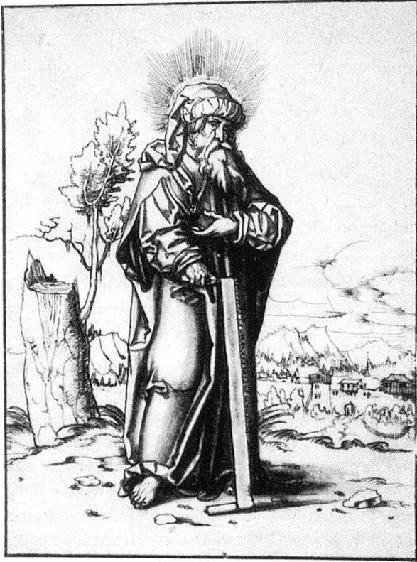
Abb. 6. Apostel Simon