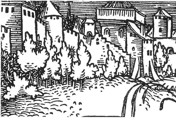
Abb. 13. Petrarcameister, Detail des Holzschnitts M. 215 aus Petrarcas Trostspiegel, 1532

stellt» (M. 275) vergleichen kann. Die angedeuteten Palmenwipfel, die Palmettenbäumchen mit den gleichsam «festonierten» Umrißlinien, die Gewanddrapierung mit dem langen, am Boden schleifenden Mantelende, das alles spricht die Formensprache des Petrarcameisters. Die Art der Aufteilung des Baumstumpfes mit dem in der aufgeplatzten Rinde erscheinenden Dreieck des Stammholzes (vgl. hierzu Brosamers Johannesholzschnitt, Gutenberg-Jahrbuch 1953, S. 85, Abb. 11), die senkrecht geführte Rundbogenlinie am rechten Stammrand, die Wurzeln, die in zwei Spitzen auslaufen sind ähnlich im Baumstumpf der Bartholomäusdarstellung zu verfolgen.