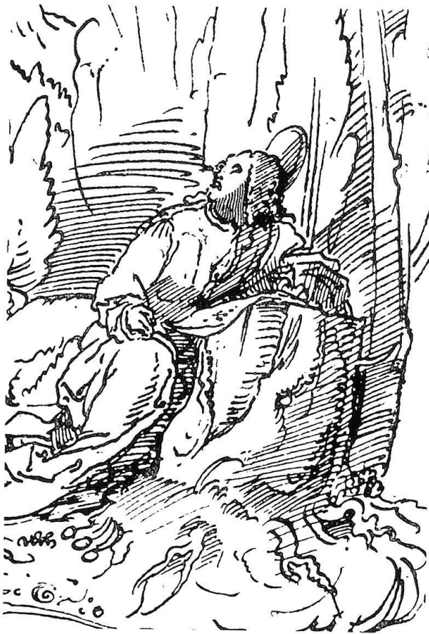
Abb. 15. Detail der Federzeichnung zu Burgkmairs Johannesaltar, v. 1518, Stockholm, Nationalmuseum

Petrarcameister angehört, sondern Burgkmair, und damit die Johannesaltarskizze dessen Eigentum bleibt, oder aber, daß beide von der Hand des Petrarcomeisters stammen.