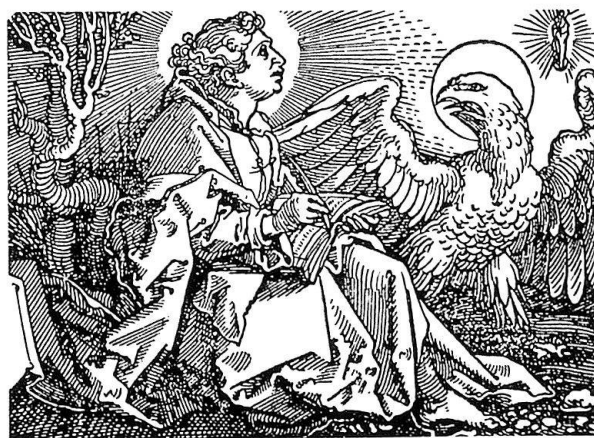
Abb. 2. Holzschnitt aus Novi Testamenti Icones , Fft-M. 1551 (H. S. Beham, P. 355)