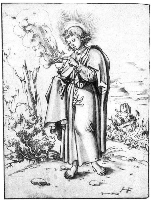
Abb. 9. Apostel Johannes

Abb. 6–9. Lavierte Federzeichnungen des sächsischen Monogrammisten HB. Pavia, Museo Civico