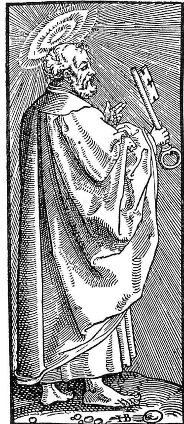
Abb. 4. Hans Brosamer, Holzschnitt aus dem Rahmen des Traubüchleins für die Einfeltigen Pfarrherrn Fft.-M. 1550

mit Steinchen zu verwechselnden «Brosamen», wies ich schon an einem seiner Wappenholzschnitte nach (Gutenberg-Jahrbuch 1953 Abb. 3) und zeige es hier erneut an einem Holzschnitt aus dem Rahmen des Traubüchleins für die Einfeltigen Pfarrherrn, Frankfurt a. M. 1550, doch vielleicht früher entstanden (Abb. 4). Wie ich bereits darlegte, benutzte Brosamer weiterhin Brosamkraut und -blume als redende Signaturen. In einer demnächst zur Veröffentlichung gelangenden Untersuchung über die Burgkmair-Werkstatt und den Petrarcameister weise ich seine Beteiligung an den Weißkunigillustrationen nach, die er als Geselle Burgkmairs unter dessen Monogramm schuf. Eines der dort erwähnten Blätter (Seite 233 der Wiener Faksimile-Ausgabe) zeigt genau in der Mitte des Unterrandes eine Krautpflanze, die vielleicht als Brosamkraut gedeutet werden kann (Abb. 5) und damit den Namen des Künstlers andeutet, ein weiteres Blatt (S. 271 der gleichen Ausgabe) weist neben einem Steinchen mit dem Burgkmairmonogramm die gleiche Pflanze auf. Dieselbe Pflanze findet sich auch in