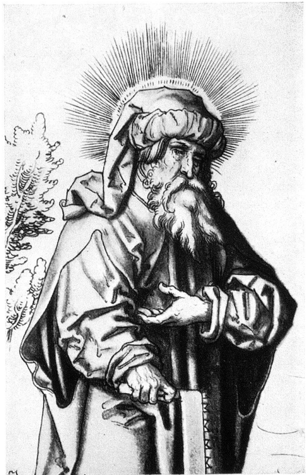
Abb. 10. Detail aus Abb. 6

Beim Vergleich der Apostelzeichnungen mit den Holzschnitten des Petrarcomeisters sind auch die Grasnarben zu Füßen der Apostel mit ihren starken, sich seitlich zu Boden biegenden Halmen zu beachten. Als Büschel mit nach beiden Seiten ausbiegenden Halmen erscheinen sie im Holzschnitt der Kindheit Christi (M. 362) oder im Ulysses an der Spitze des Heeres (M. 547), wie sie ebenso im Weißkunigholzchnitt, dessen Detail gezeigt wurde (Abb. 5), vorkommen. Als letzte Einzelheit möchte ich auf die Behandlung von Baumstämmchen in den Apostelblättern und beim Petrarcomeister hinweisen. Das Baumstämmchen des Johannesblattes sehe man zusam-