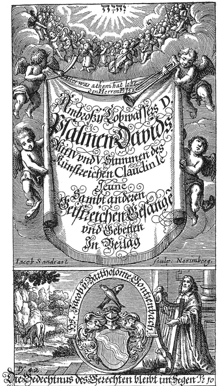
Abb. 5. Kupfertitel und Titelpuffer des musikalisch bedeutsamsten Basler Gesangbuchdruckes mit den Psalmsätzen von Claude Le Jeune (um 1530–1600) und Liedsätzen wahrscheinlich vom Basler Johann Jacob Wolleb (1613 bis 1667), gedruckt 1659 bei Joh. Jac. Genaths sel. Wittib auf Veranlassung der St. Galler Leinwandfabrikanten Joh. Jac. und Barth. Gonzenbach.

bis heute noch nicht gedeutet worden ist 38 . Von der Bedeutung dieses Gonzenbachschen Gesangbuches für die ladinisch sprechenden Gemeinden zeugt aber vor allem der Nachdruck der Le Jeune-Sätze (mit den romanischen Psalmtexten Lurainz Wietzels von 1661), der 1733 in Strada, der un-