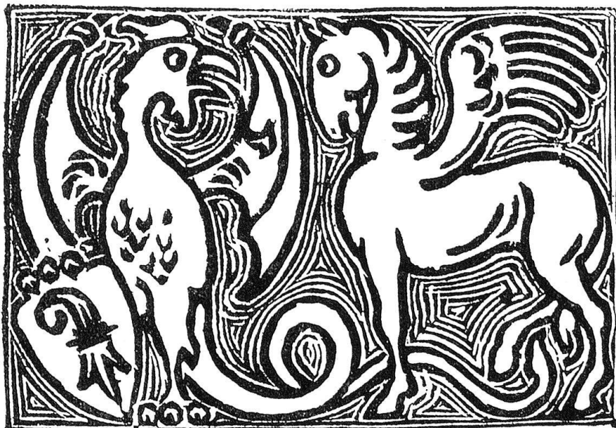
Theodor Barth. Umschlagsvignette von 1921

Nur eines erschien wider die Regel am 29. Mai 1921. Auf dem dunkel gewolkten Umschlag dieses Sondermaielis sitzen, wie Sonnen und Sterne am Firmament, lichte Kreise und Punkte, die von zwei schwarzen Wappentieren beherrscht werden. Links im Feld hält ein munterer ringel-