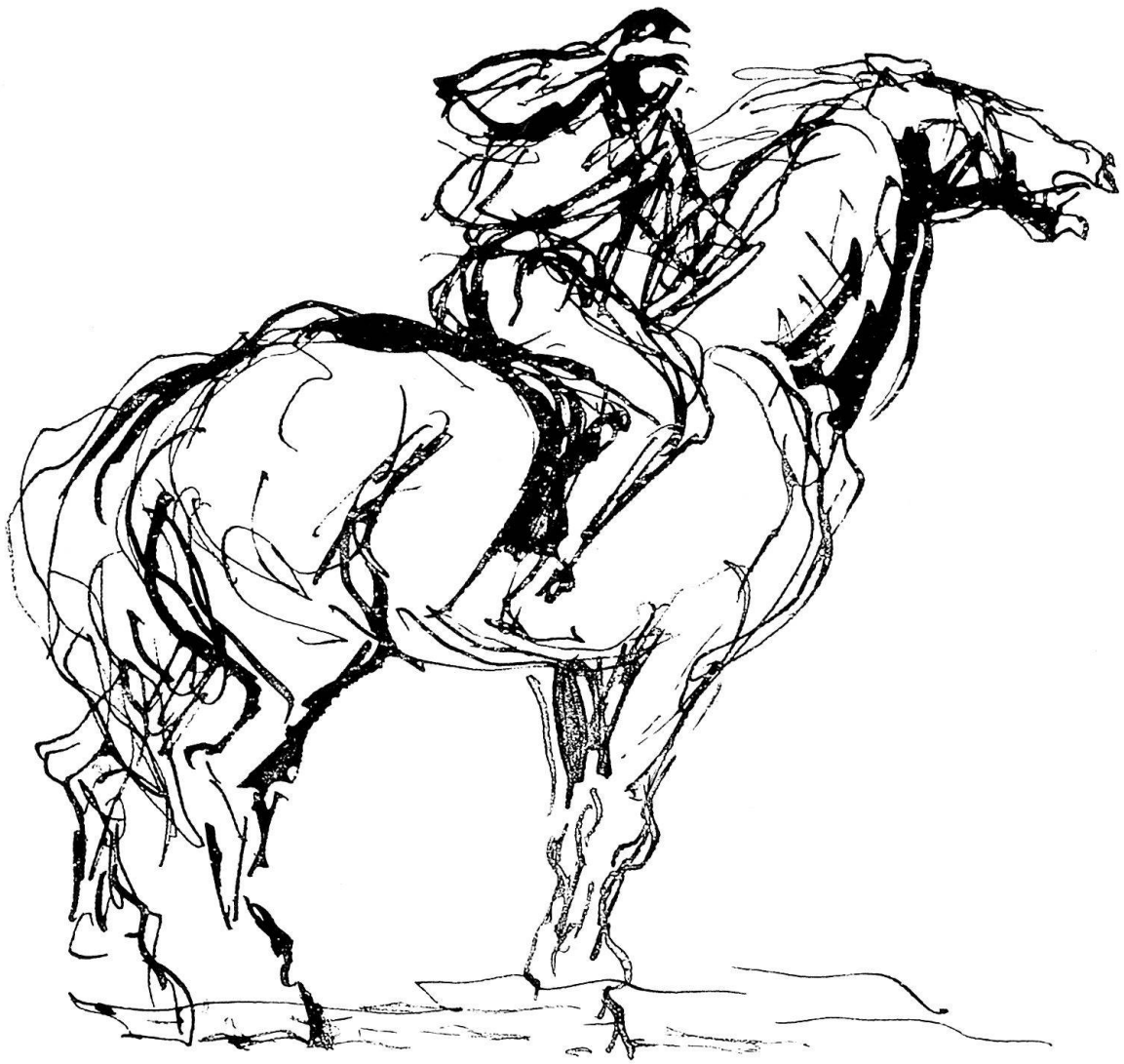
Aus dem Tagebuch eines Malers, von Gunter Böhmer. Zeichnung in Originalgröße.

sogar vom Dichter selbst in grünes Oasenziegenleder gebunden.