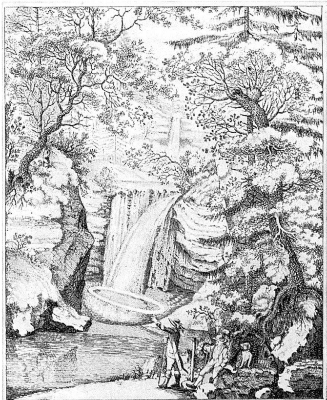
Der Kessel im Mühlthal im Canton Schafh.

Noch über viel anderes weiß Fischer von seinem Aufenthalt bei Watt zu erzählen. Daneben ist er nicht blind für landschaftliche Eindrücke und versteht, sie bildhaft wiederzugeben. So wenn er von den Höhen des Dudley-Castle die Strahlen der sinkenden Sonne schaut, die nach seinen Worten «mit den mehrere Stunden im Durchmesser haltenden