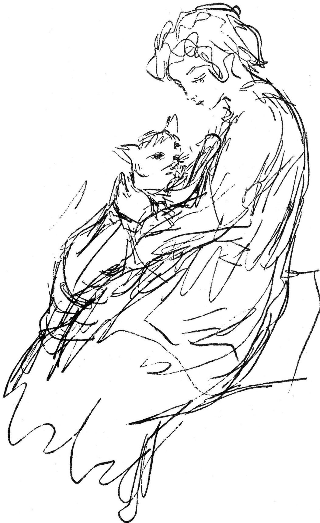
Laprade: Fillette au chat. Dessin à la plume, 23,5 x 15,5. Galerie Granoff, Paris.