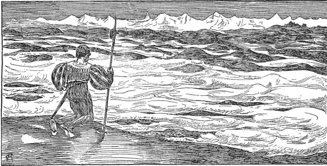
Cuno Amiet (1901). Huldigung.

schließen, sie erfordert demnach eine Berichtigung. Bestätigt wird, wie wir mit Freuden sehen, die Wahrnehmung, auf die wir glaubten, am Schlusse als auf einen Fund hinweisen zu dürfen: Cuno Amiets stille Neigung für geschichtliche Vorwürfe. Ohne sie wären diese prächtigen Darstellungen kaum entstanden. Wir können es uns nicht versagen, zwei der (wer würde dies heute noch glauben!) ihrer Zeit weit vorausseilenden Zeichnungen wiederzugeben, die zeigen, daß der Höhenflug des damals noch jungen Künstlers ihn