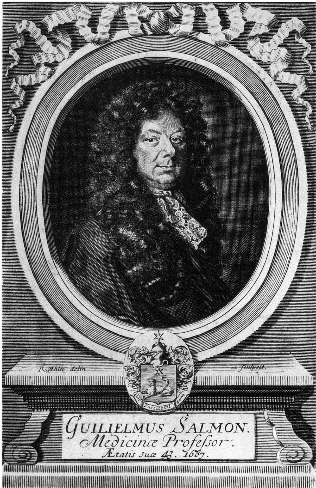
William Salmon (1644–1713), «charlatan» et grand bibliophile. Gravure de R. White, 1687