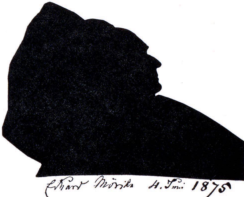
Eduard Mörike zwei Stunden nach seinem Tode, 4. Juni 1875

So reizvoll jede Silhouette als Einzelstück, zumal auch für familiengeschicht-