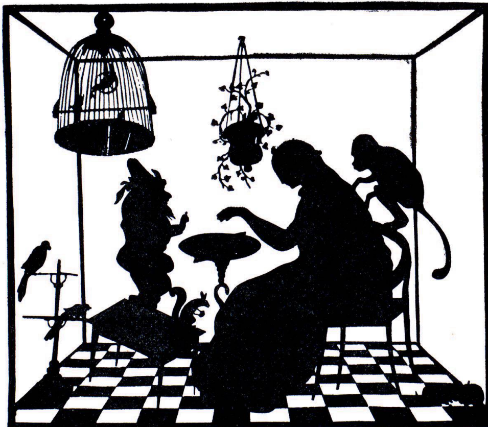
Die schöne Lau beim Schachzettel. Scherenschnitt zu Mörikes «Stuttgarter Hutzelmännlein», 1853