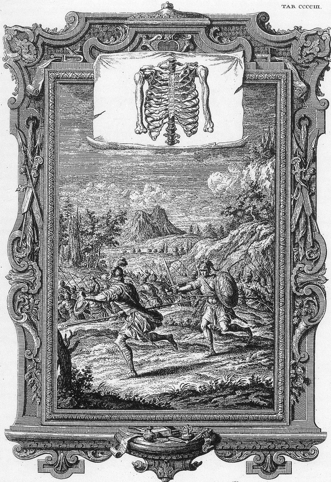
II. SAM. Cap. II. v. 23. Achelis Vulnus lethale.