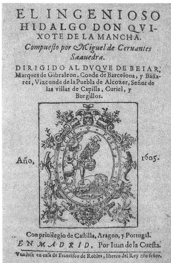
Titelblatt der ersten Auflage von Cervantes' «Don Quijote».