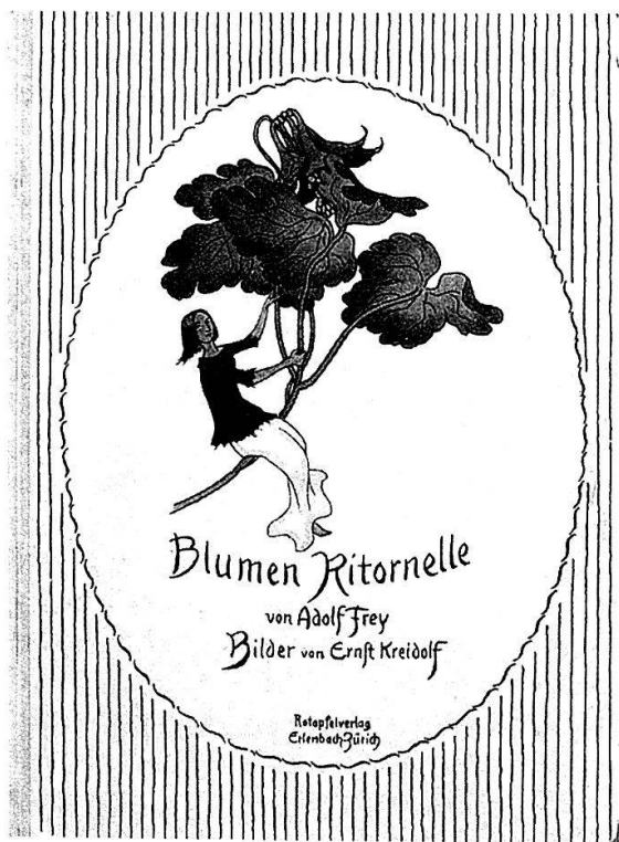
Rotapfel-Verlag Erlenbach-Zürich. 1920.