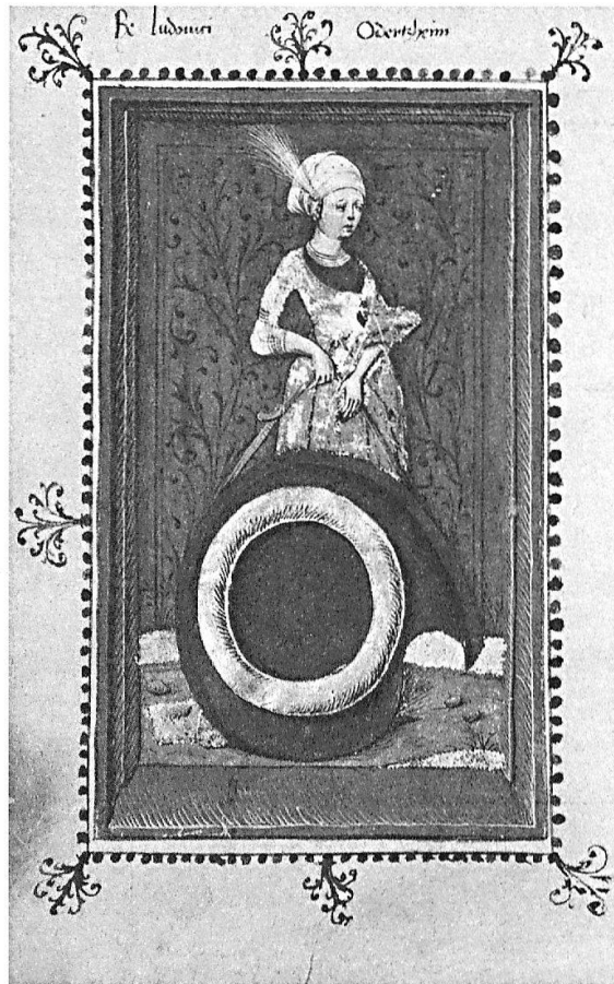
Rektoratsmatrikel, fol. 69v. Das Wappen des Rektors Ludwig Odertzheim (1486) zeigt einen Kringel, der wohl den Anfangsbuchstaben des Namens versinnbildlicht. Das Wappen wird gehalten von einer zarten Frauenfigur auf rotem Grund, die noch ganz die feine Sensibilität gotischer Kunst zeigt.

jeder Seite erwartet einen Reizvolles und Interessantes. Von den prächtigen Bildern angezogen, kann sich der Leser in die Geschichte vertiefen. Das ist heute ohne allzu große Mühe möglich, denn der Text ist ediert (Wackernagel 1951–1956), und die