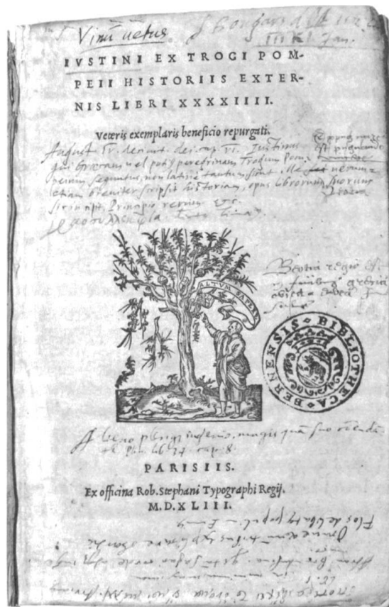
Titelblatt der bei Robert Estienne 1543 in Paris gedruckten Justin-Ausgabe, mit handschriftlichen Notizen von Bongars. Es handelt sich um das Arbeitsexemplar für seine eigene Justin-Edition von 1581, das rechts oben den Datumsvermerk 1577 trägt (Universitätsbibliothek Bern, ZB Bong V 608, S. 1).